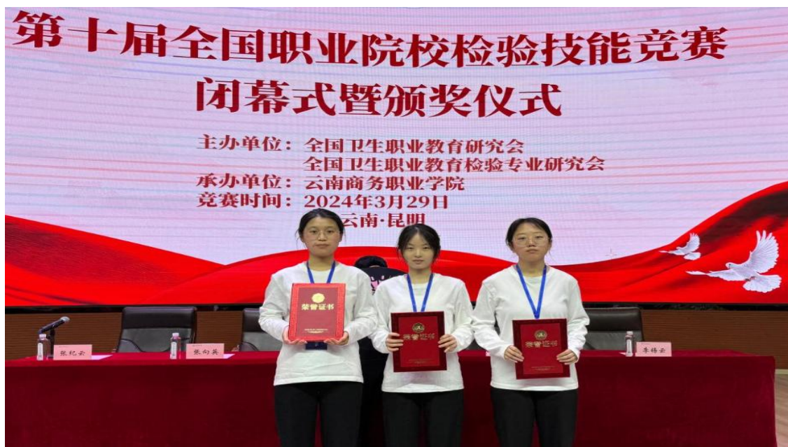
图 2-9 临沂卫校在第十届全国检验技能竞赛中喜获佳绩

创新创业大赛。在 2024 年“淮海职教杯”创业大赛中获中职组二等奖 1 项、高职组三等奖 2 项；在第七届“临沂市黄炎培