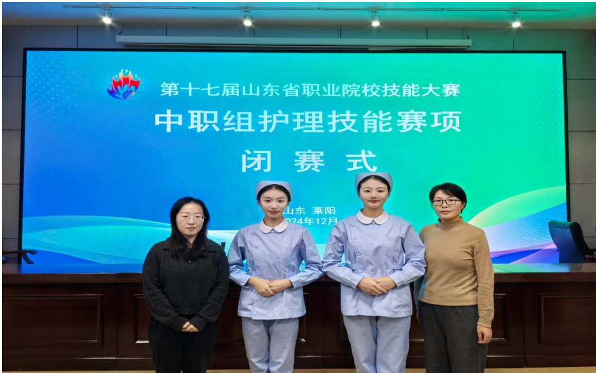
图 2-11 学校积极参加、承办各级各类职业技能大赛

升，2024年山东省职业院校技能大赛中职组护理技能赛项学校师生代表队获得团体二等奖的优异成绩。