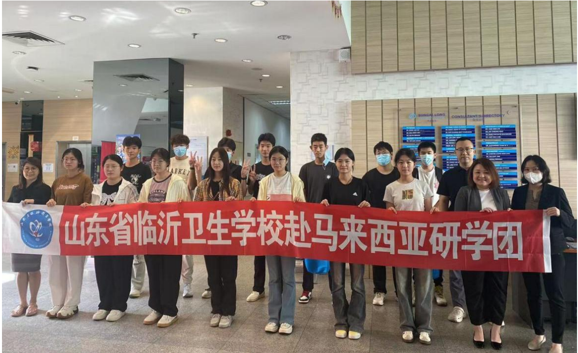
图 6-2 护理专业在校生“研学行”