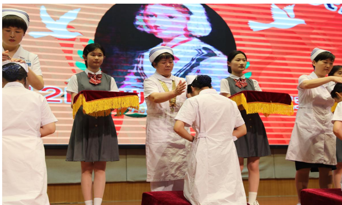
图 5-1 临沂卫校举行 5.12 国际护士节授帽仪式

理解。2024 年举办临沂卫校 5.12 护士节授帽仪式、第三届药剂专业漫画创意大赛、护理技能比赛、第四届解剖绘图大赛、药学技能比赛、临沂卫校检验知识竞赛、临沂卫校护士礼仪比赛、临沂卫校医学影像技术专业实践技能大赛、匠心能手评选等技能素质类活动,在传承工匠精神方面,取得了显著的成效,下一步,学校将继续深化改革,创新举措,为培养具有工匠精神的医药卫生技能型人才不懈努力,为临沂市职业教育发展贡献力量。