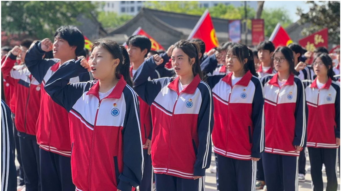
图 2-2 团员代表参加山东省规范化入团宣誓仪式

扬沂蒙精神 青春挺膺担当”山东省示范性入团仪式，进一步提升共青团的凝聚力和吸引力。