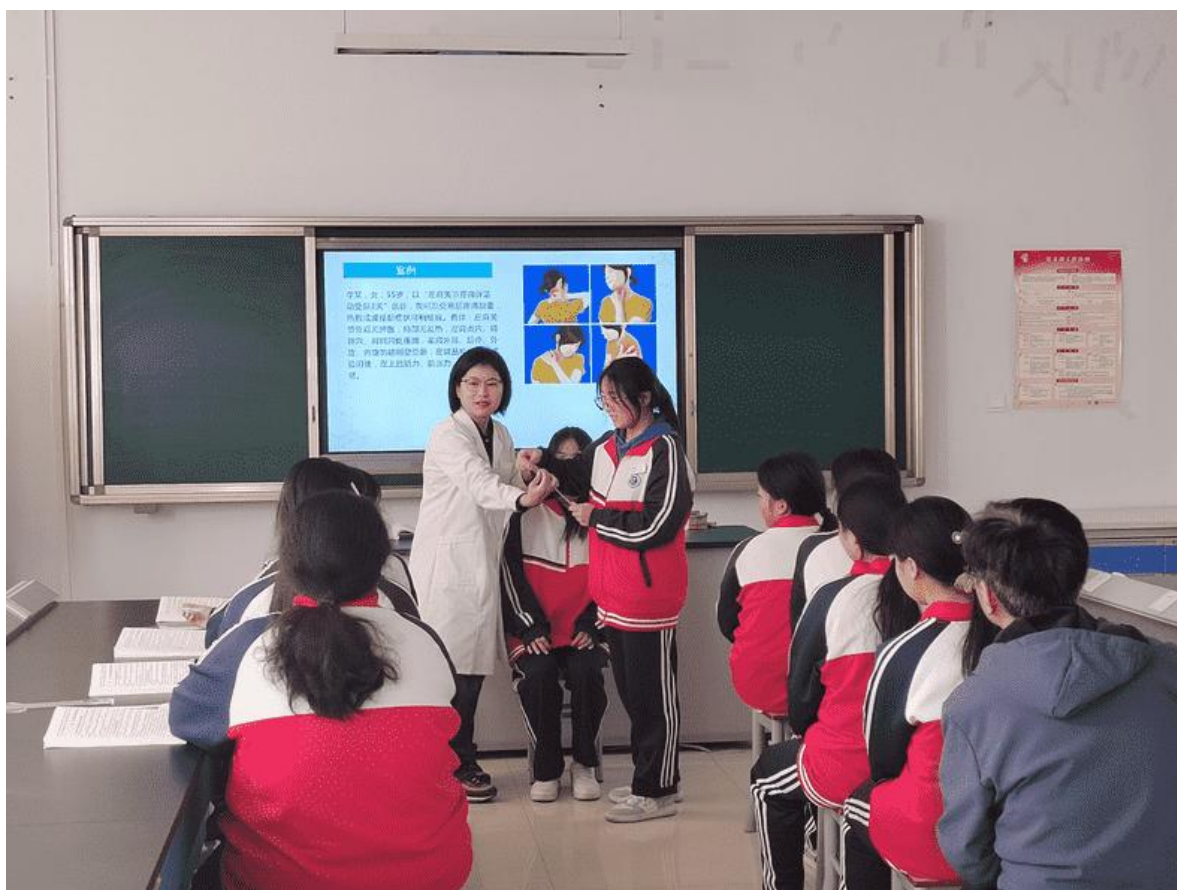
图 3-1 康复专业部举行教学模式公开课

和共同讨论，相互借鉴，提高教学水平，提升教学质量。同时，扩充学校数字化教学资源，推行线上线下相结合的教学方法，将在线教学的优势和传统教学的优势整合起来，引领学生由浅入深地进行深度学习，实现“线上有资源、线下有活动，过程和结果有评估”，真正实现以教师的“教”为中心转为学生的“学”为中心。