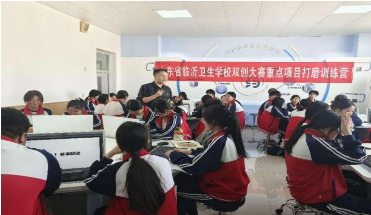
图 2-13 临沂卫校双创大赛学生训练营现场