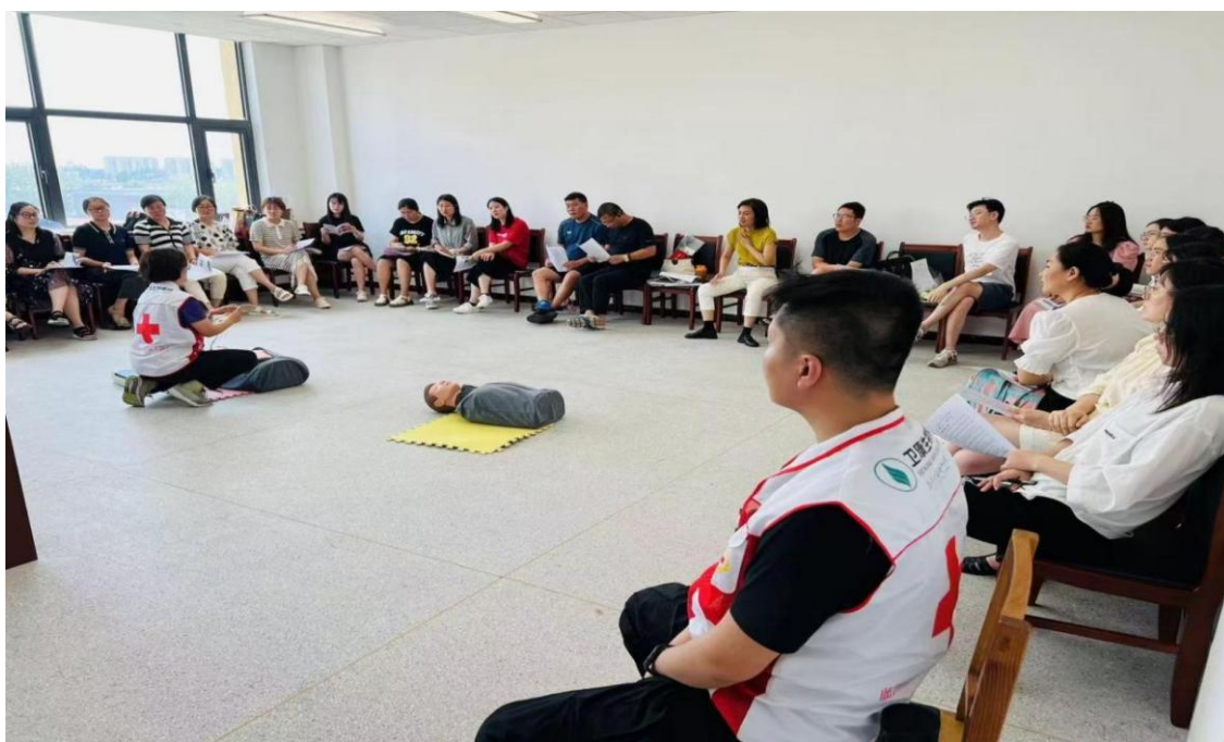
图 4-4 兰山区教体系统初级救护员培训实操内容授课现场

通过这些培训项目的实施，临沂卫校不仅为学生提供了实践和就业的平台，也为社区居民提供了学习和提升的机会，有力地推动了地方人才的培养和服务能力的提升，为地方经济社会发展做出了积极贡献。