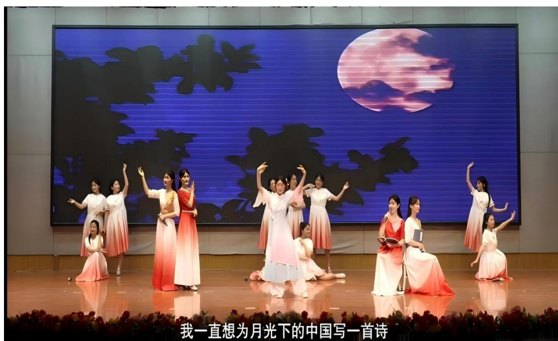
图 5-3 学生诵读作品《月光下的中国》

不仅扎实专业知识技能，更在职业道德、文化自信与人文关怀等综合素养方面显著提升。2024年，选送的诵读作品《月光下的中国》《回家》分别获山东省中华经典诵读大赛中职学生组一等奖、二等奖。其中，《月光下的中国》获全国第六届中华经典诵写讲大赛“诵读中国”经典诵读大赛职业学校学生组优秀奖。