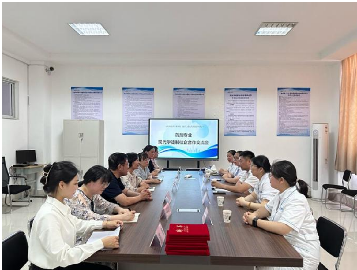
图 7-3 药剂专业部与仁德大药房举办现代学徒制校企合作交流会

学校和企业签订现代学徒制人才培养项目合作协议。共同制定核心课程的课程标准、岗位标准，共建人才培养方案。学校导师与企业师傅互聘融合形成能适应现代学徒制教的“双导师”团队。教学实行差别管理和评价制度，做到企业考核与学校考核互评融合。