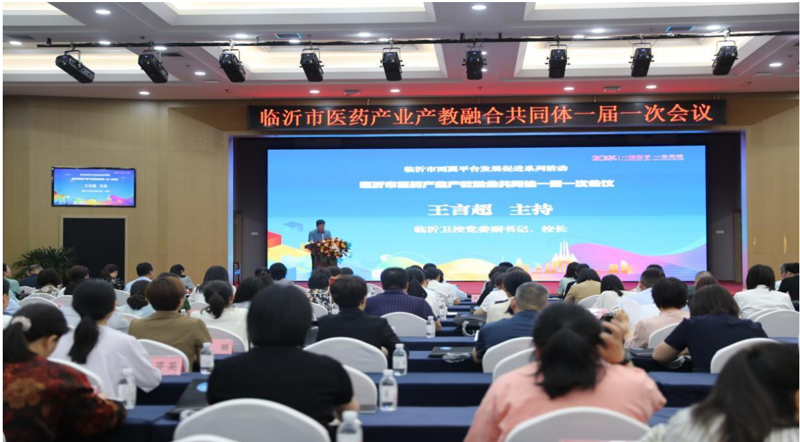
图 7-1 召开临沂市医药产业产教融合共同体一届一次会议