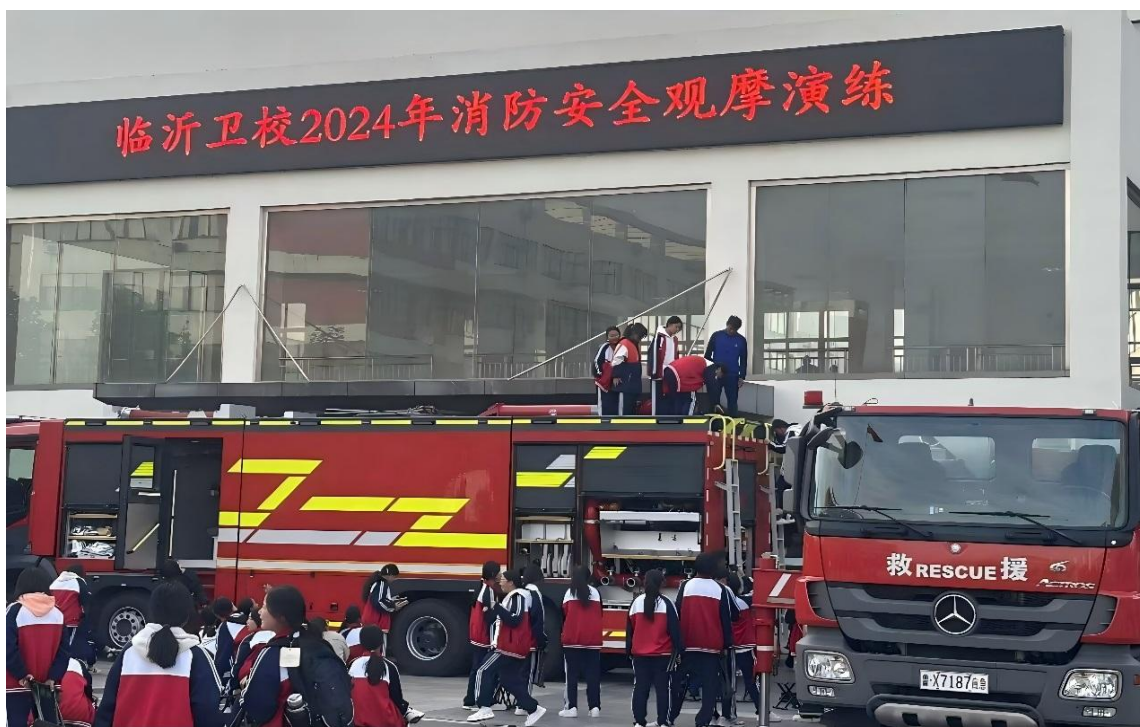
图 2-8 开展“消防安全宣传月”系列活动