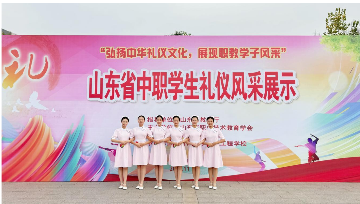
图 2-3 参加山东省中职学生礼仪风采展示

学生礼仪风采展示、山东省中华经典诵读大赛，营造浓厚的“热爱艺术、崇尚艺术”的校园文化氛围；组织参加临沂市中小学生“学宪法 讲宪法”活动，积极营造尊崇宪法、维护宪法和运用宪法的良好氛围。