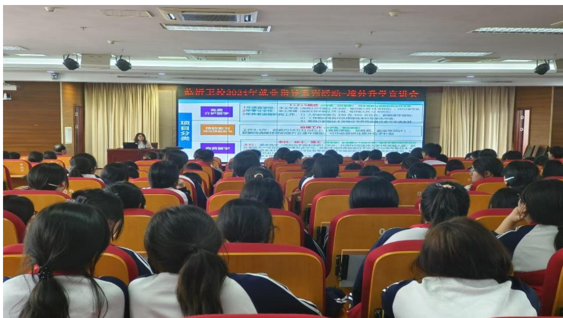
图 2-12 学生参加就业指导专题讲座

岗位迁移能力。 通过就业主题班会、就业知识讲座、专场招聘双选会、校内职业规划大赛等活动有效锻炼学生的学习能力、岗位适应能力和岗位迁移能力。