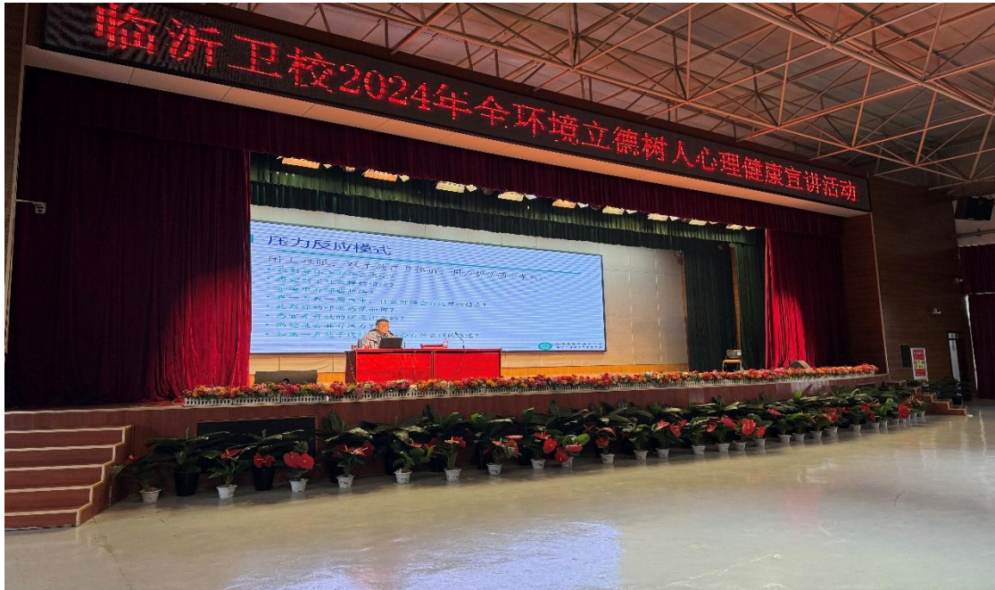
图 2-4 全环境立德树人心理健康教育宣讲