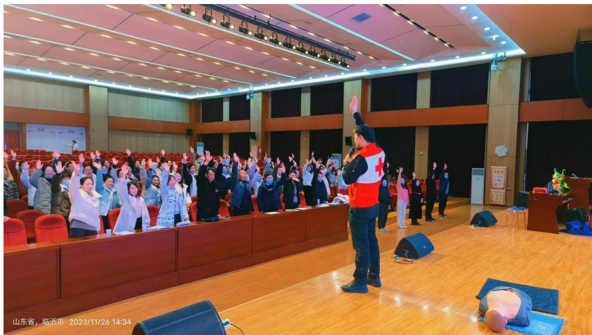
图 4-3 失智老年人照护 1+X 证书