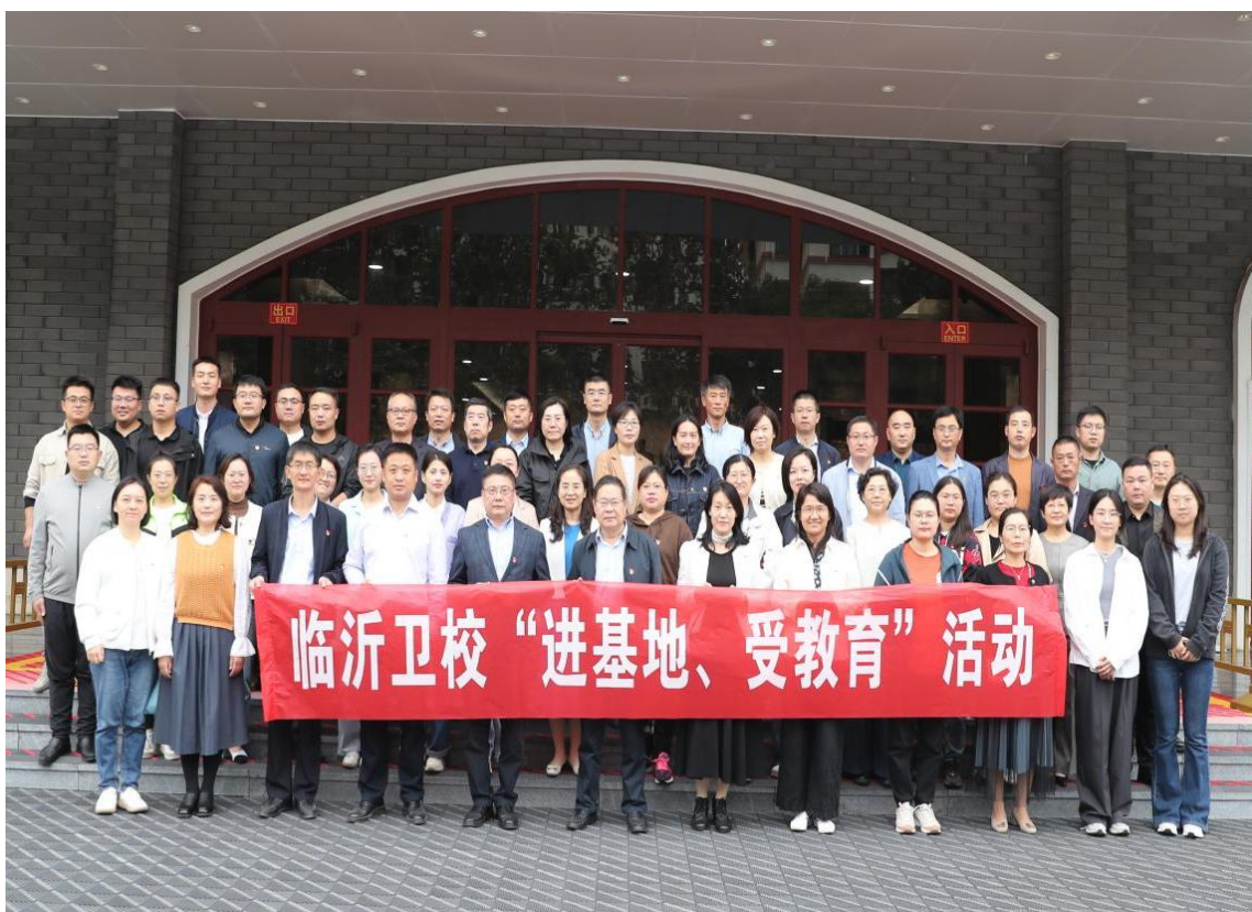
图 8-1 临沂卫校开展“进基地 受教育”活动

应。积极开展党建类课题研究，完成省级党建研究课题 1 项。坚持党建带工建，完善工会组织体系建设和相关制度，定期召开教代会、工代会；深入推进团学组织改革，打造“四青”团学品牌，构建党委领导下的“一心双环”团学组织格局，党建带团建取得显著成效。