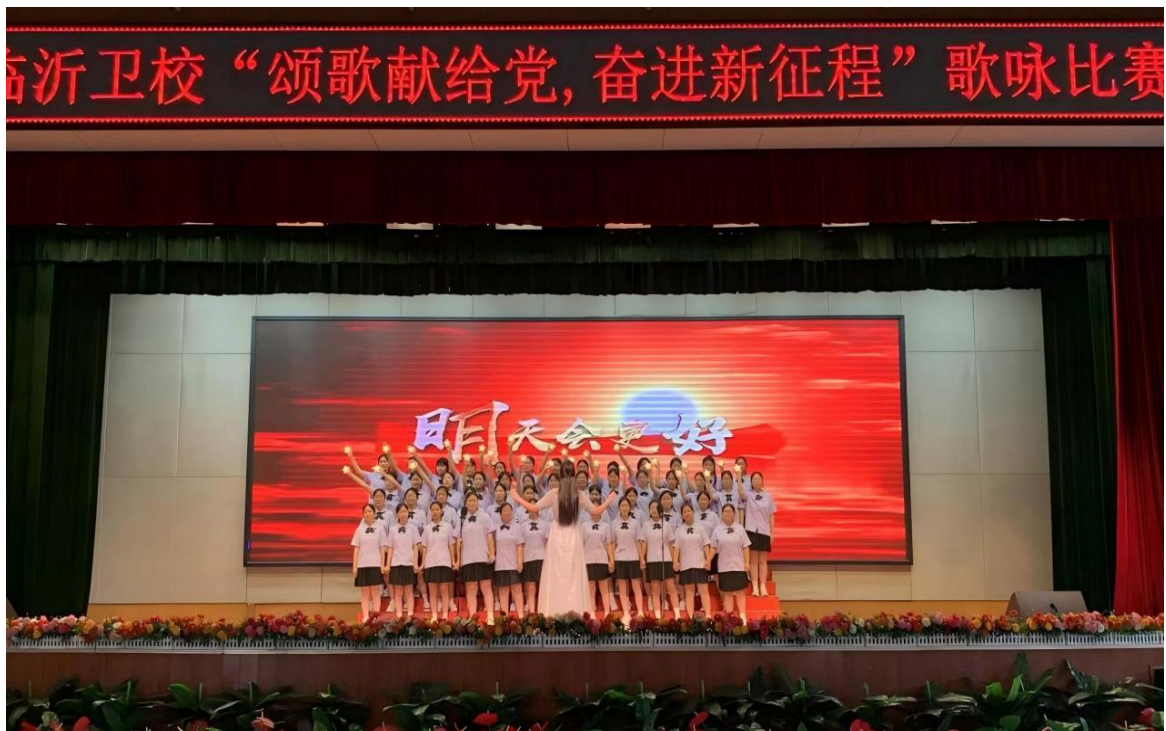
图 5-2 开展“颂歌献给党 奋进新征程”庆七一歌咏比赛