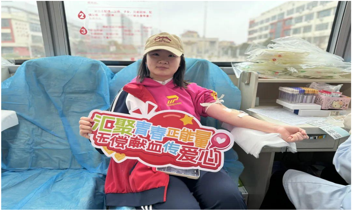
图 2-6 青年志愿者参加无偿献血活动

过健康义诊、社会调研、红色教育基地参观学习，进一步增强服务群众、为乡村振兴再添新力的使命感。