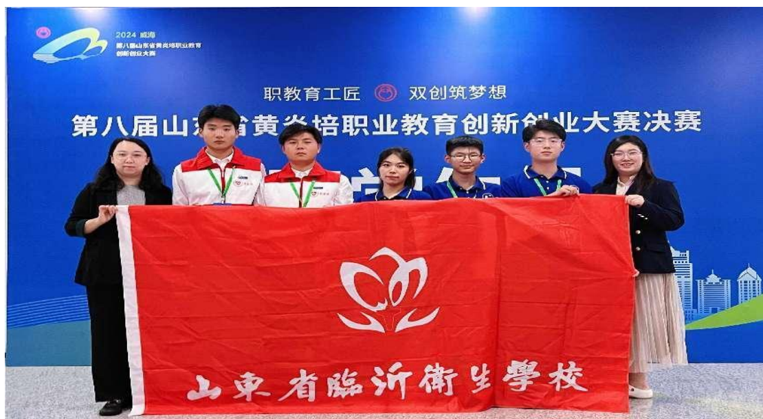
图 2-10 第八届山东省黄炎培创新创业大赛现场决赛

创新创业大赛”中获中职学生组一等奖2项、二等奖4项、三等奖3项，学校荣获优秀组织单位奖；在第八届“山东省黄炎培创新创业大赛”中获中职学生组二等奖2项、三等奖2项。