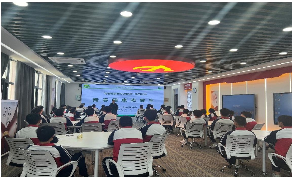
图 2-5 “青春健康教育进校园” 公益科普活动

们结合实际案例，深入浅出地讲解青春期心理特点、职业规划中的心理调适等知识，拓宽了学生的视野，增强了学生对心理健康的重视程度。经过努力，学校心理健康教育工作取得显著成效。学生心理健康知识知晓率大幅提升，心理健康水平明显提高，因心理问题引发的违纪事件显著减少。