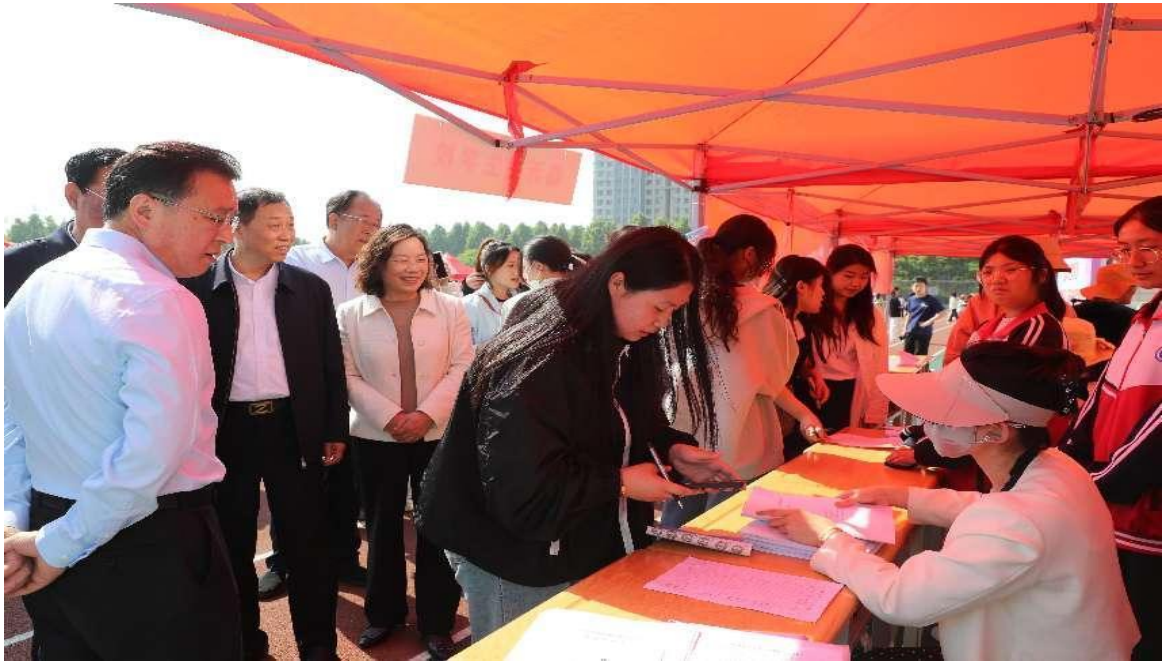
图 2-14 学生参加“就选山东 乐业临沂”毕业生供需见面洽谈会

通过这些策略，学校不仅为学生提供了全面的职业技能培养，也为他们未来的职业发展奠定了坚实的基础。