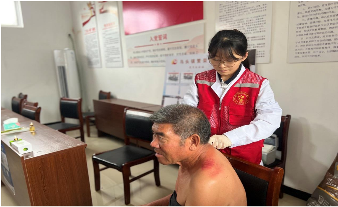
图 2-7 “天使刮痧”志愿服务队队员为村民进行刮痧理疗

扎实筑牢学校法治安全教育防护网。每学期邀请公安、司法、律师等法律专家来校做学生欺凌防治、消防安全、人身安全、交通安全、防电信诈骗、网络安全等内容的教育讲座，有效的促进了学校法治教育工作的开展；定期组织学生、教职工、公寓管理、炊事员、志愿消防员等人员开展消防灭火演练、应急疏散演习，提升师生员工的安全意识和应急处置能力。