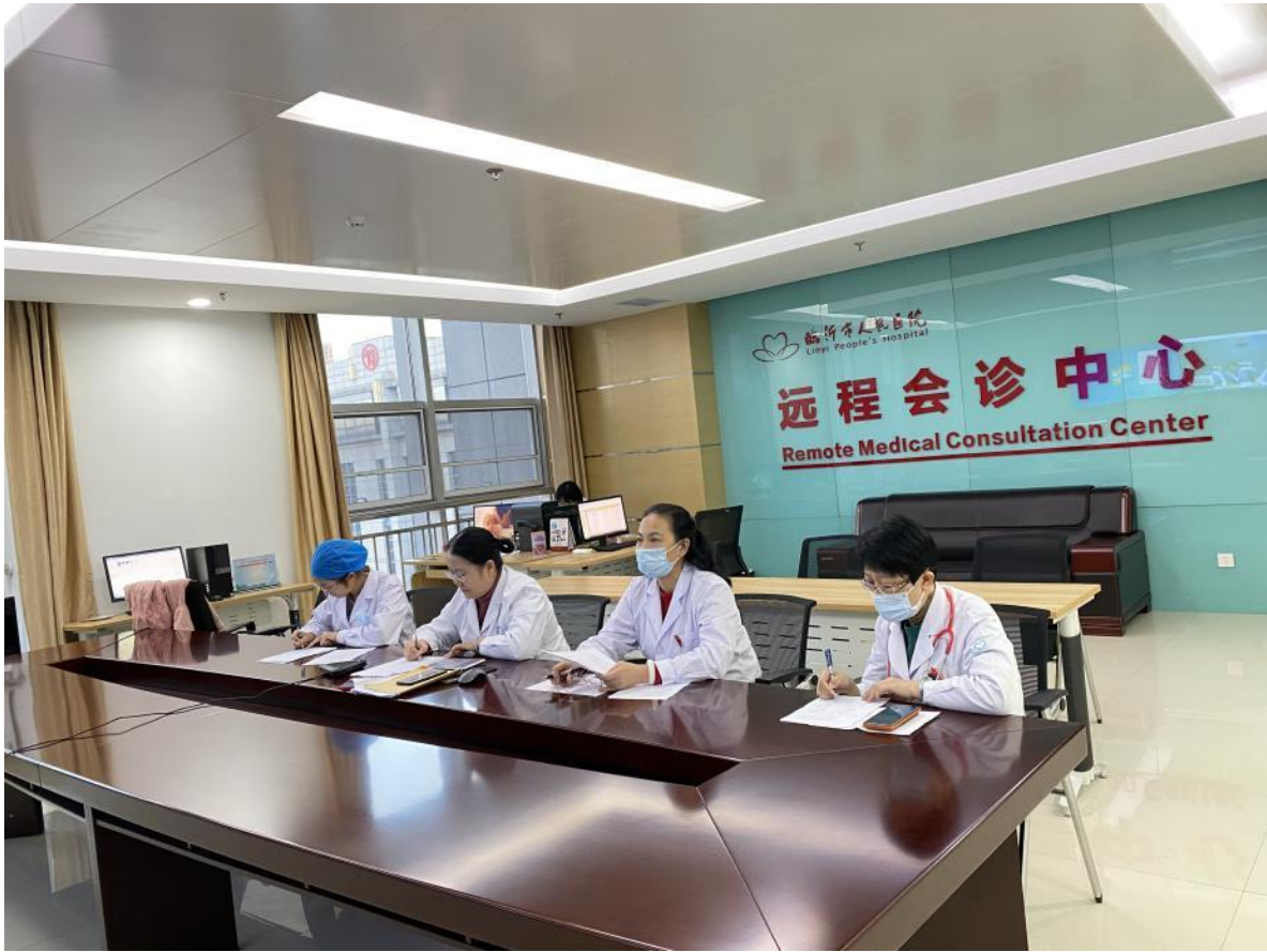
图 4-1 临床教师在医院参加会诊工作